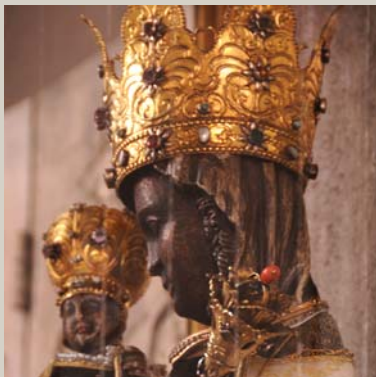
Wallfahrtskirche St. Josef „Schwarze Madonna“