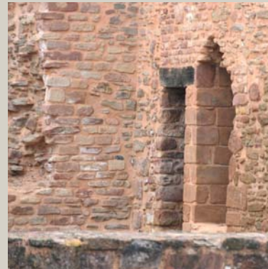
Burg Bucherbach (14. Jh.)