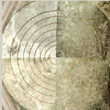
Evang. Martinskirche Kölln, Deckenfresken (13.–16. Jh.)