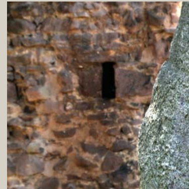
„Hexenturm“ (15. Jh.)